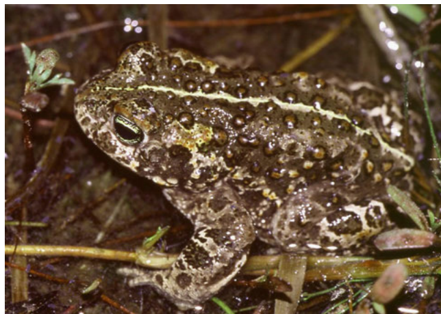
Rugstreeppad (Bufo calamita)

De Wet natuurbescherming biedt de mogelijkheid om een programmatische aanpak ook toe te passen binnen het soortenbeleid. In lijn met de inzet voor het toekomstige omgevingsrecht en het streven om economie en ecologie meer met elkaar te verbinden, wordt de programmatische aanpak breed inzetbaar voor Natura 2000-gebieden en voor het soortenbeleid. Een dergelijk programma kan zowel door het Rijk als door provincies worden opgesteld.