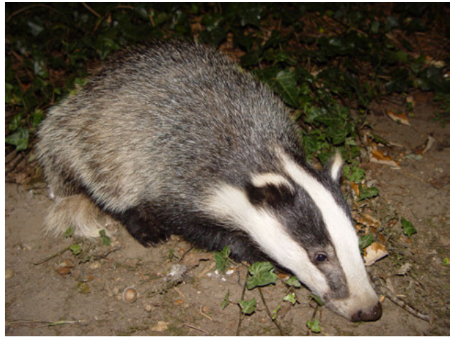
Das ( Meles meles )

Het aantal exemplaren van een beschermde inheemse soort dat in een bepaald geval verstoord wordt, is voor de vraag óf het verbod op verstoring overtreden wordt niet relevant, ook niet indien er geen afbreuk wordt gedaan aan de staat van instandhouding van de soort 2) . Anderzijds hoeft niet iedere handeling die tot gevolg heeft