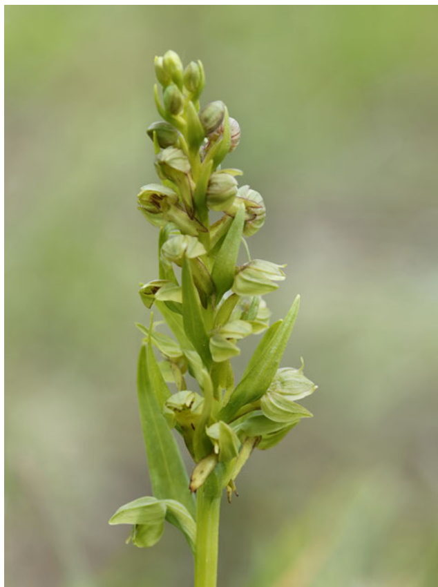
Groene nachtorchis (Coeloglossum viride)

Om te bepalen of strikt beschermde soorten dan wel hun voortplantings- en rustplaatsen of nesten voorkomen kunt u de hulp inschakelen van een ecologisch deskundige. U kunt ook de Nationale Databank Flora en Fauna raadplegen.