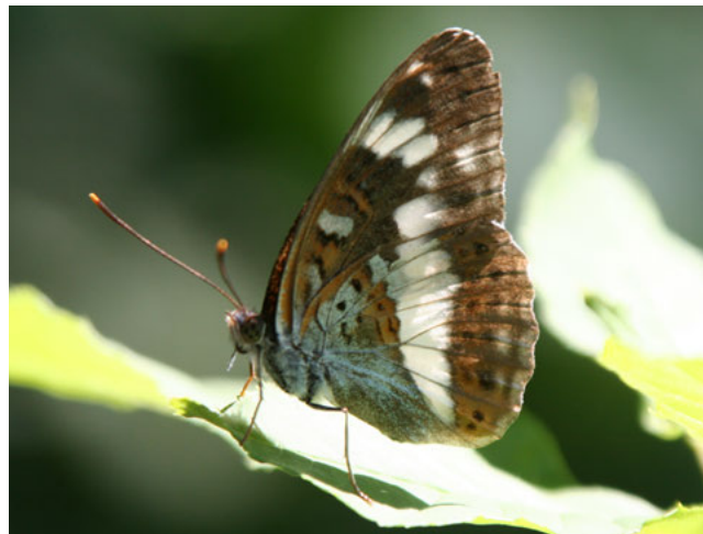
Kleine ijsvogelvinder ( Limenitis camilla )

Maatregelen die de effecten op de plek van handeling herstellen, zijn mitigerend van aard; maatregelen die de effecten voor de populatie opheffen door herstel of verbetering op een andere plek zijn compenserend van aard. Overigens wordt bij soortenbescherming geen scherp onderscheid gemaakt tussen mitigerende en compenserende maatregelen (dit in tegenstelling tot gebiedenbescherming). Belangrijk is dat de staat van instandhouding gegarandeerd wordt.