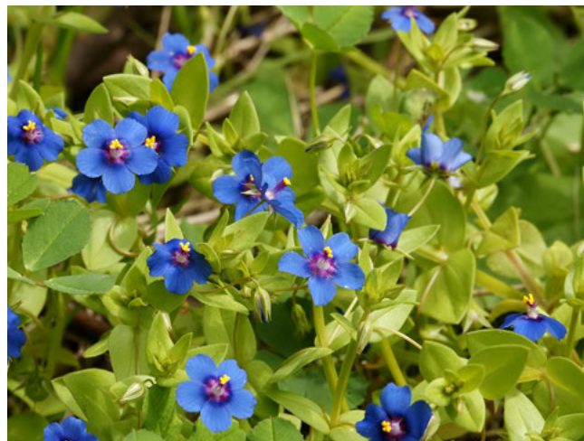
Blauw guichelheil ( Anagallis arvensis foemina )