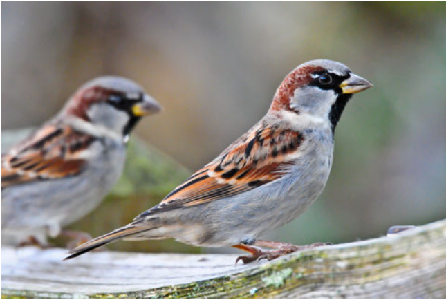
Huismus ( Passer domesticus )