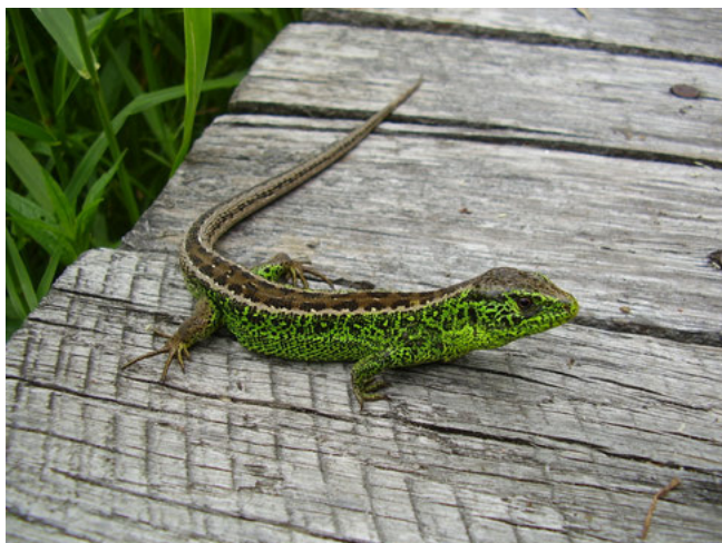
Zandhagedis ( Lacerta agilis )