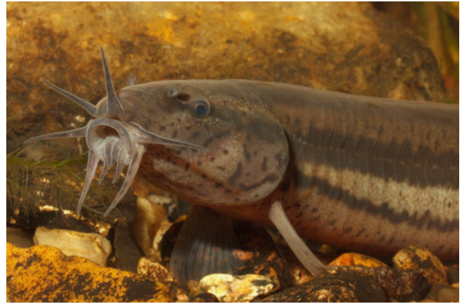
Grote modderkruiper ( Misgurnus fossilis )